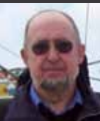
Pierre Milliez Dieu utilise même nos épreuves Page 10